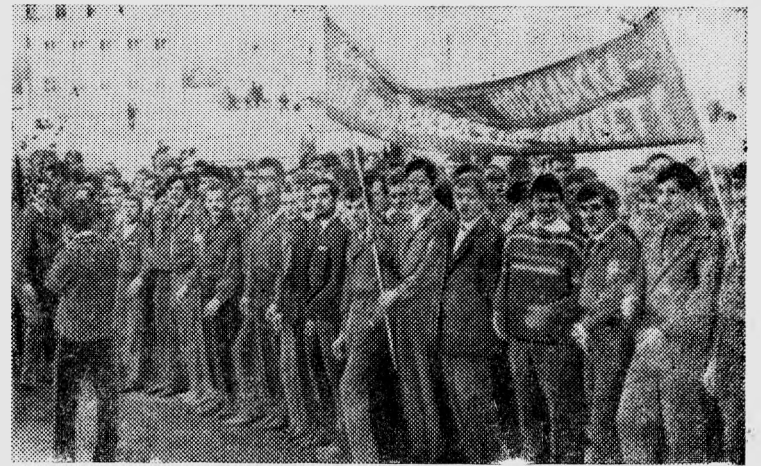
На снимках: отряд «Талнах» в заполярном Норильске. И пускай нам порою трудно,

Летом этого же года студенты-первокурсники пра-